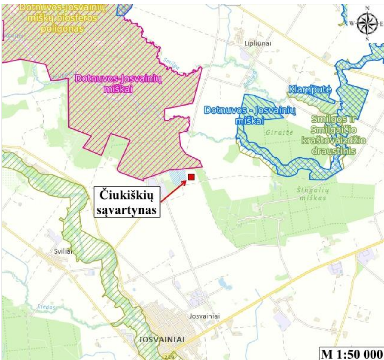
4.1 pav. Sąvartyno teritorijos apylinkių žemėlapis

Artimiausias paviršinis vandens telkinys yra melioruotas Smilgaičio upelio intakas, juosiantis sąvartyną iš šiaurinės, rytinės ir vakarinės pusės. Vadovaujantis „Paviršinių vandens telkinių apsaugos zonų ir pakrančių apsaugos juostų nustatymo tvarkos aprašu“ teritorija nepatenka į paviršinio vandens telkinių apsaugos zonas ar pakrančių apsaugos juostas [9].